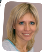
Автор: Ольга Мацкевич – учитель-логопед Российско-британского детского центра развития и творчества «Содружество»

Очень часто на нашу оценку и выбор влияют наши желания и амбиции. Мы хотим для нашего чада самую сильную школу с углубленным изучением по одному, а еще лучше нескольким предметам.